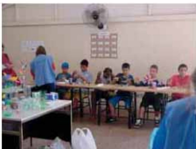
Oficinas de Reciclagem

• Oficineiros em ação: um acampamento no município de Canoas, no mês de agosto, colocou osicineiros do Programa Reciclar Banrisul em ação. Mais de 900 estudantes de 150 escolas de vários pontos do Rio Grande do Sul participaram de oficinas de teatro, dança, declamação, trova, tertúlia e montaria. Osicineiros do Reciclar mostraram a forma de atuação do Programa aos jovens participantes da ação.