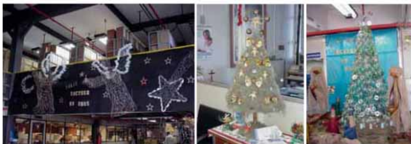
Decoração de Natal com material reciclado.

A campanha para o Natal 2004 arrecadou mais de 8.000 brinquedos, quase 3.500 quilos de alimentos e 1.205 unidades de roupas e calçados, numa ação meritória que contou com a atuação dos funcionários de diversas agências.