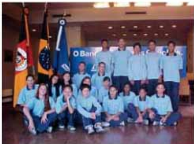
Alunos da Unidade do Projeto Pescar Banrisul

O Banrisul é a primeira instituição pública do País a ter uma unidade de ensino dentro dos padrões do Projeto Pescar.