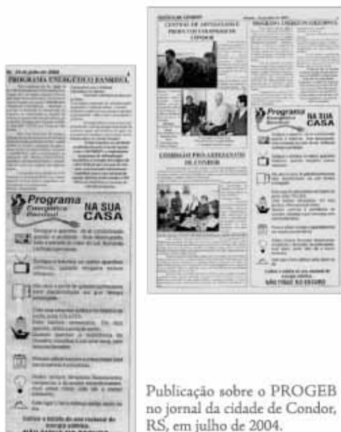
Publicação sobre o PROGEB no jornal da cidade de Condor, RS, em julho de 2004.

O Programa traz como benefícios não somente a redução de custos, mas também a contribuição da Instituição para a preservação ambiental, refletindo o compromisso com a cidadania e a responsabilidade social do Banco.