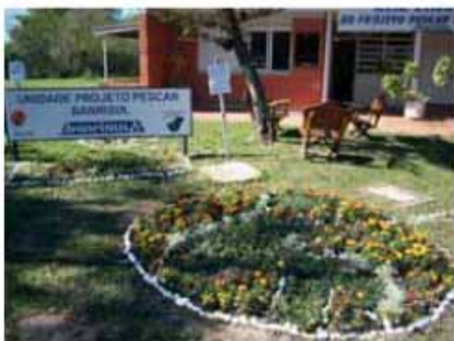
Sede da Unidade Projeto Pescar Banrisul