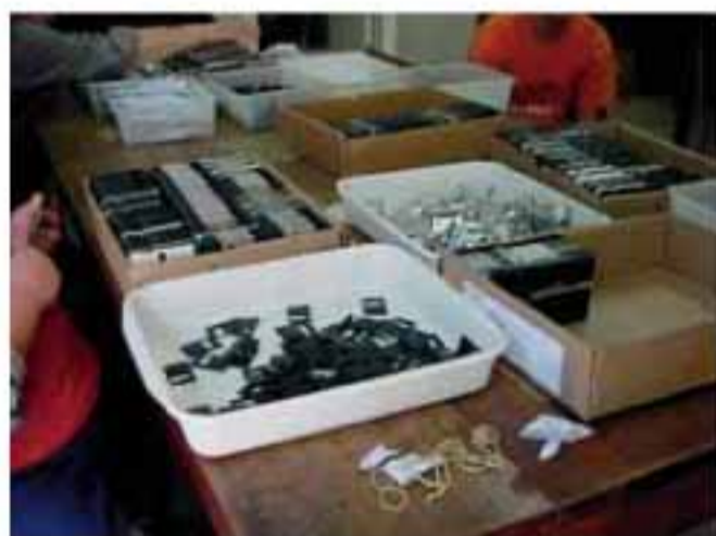
Disquetes para reciclagem

Iniciativas do programa que direcionam de forma adequada os resíduos do Banco e resultam em menor impacto ambiental contribuem para o resgate da cidadania e para o bem-estar social. Exemplo: a venda de papel para reciclagem representa mais de 24 mil árvores poupadas.